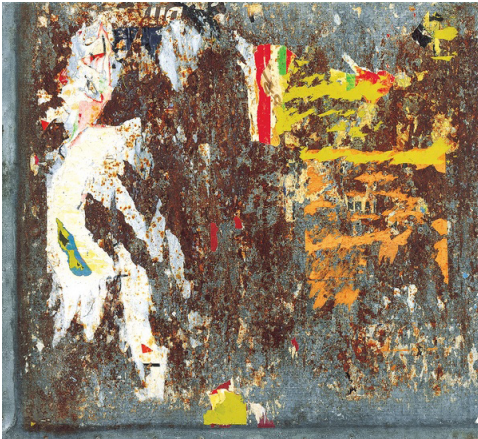
Raymond HAINS, Sans titre, 1976 Affiche déchirée sur tôle, 100 x 91 cm collection Frac Basse Normandie

1926, Saint-Brieuc (Côtes-d'Armor) - 2005, Paris