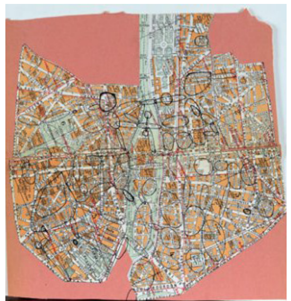
Plan de Paris avant 1957 [Relevé des unités d'ambiance des six premiers arrondissements de Paris sur un plan des Éditions A. Leconte découpé et collé sur un carton rose (26,4 cm en hauteur maximale et 27 cm dans sa plus grande largeur). Inscription manuscrite au dos : «Carte de Paris avant 1957».

extraits de la «théorie de la dérive», Guy Debord de Publié dans Les Lèvres nues n° 9, décembre 1956 et Internationale Situationniste n° 2, décembre 1958.