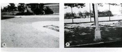
Huebler trace un hexagone sur une carte de New York et une autre sur une carte de Boston. Il photographie ensuite le lieu que lui indique chaque pointe des deux hexagones sur les cartes.

« 'Le monde est rempli d'objets, plus ou moins intéressants ; je ne désire pas en ajouter.' Cette phrase, écrite en 1969 par Douglas Huebler, est emblématique du discours sur la dématérialisation de l'art de la fin des années 1960. On oublie toutefois souvent de citer son corollaire : 'Je préfère simplement constater l'existence des choses en termes de temps et/ou de lieux. Plus spécifiquement, je m'intéresse à des choses dont l'interrelation se situe au-delà de la perception immédiate. En ce sens, mon travail dépend d'un système de documentation. Cette documentation peut prendre la forme de photographies, de cartes, de dessins ou de descriptions'.