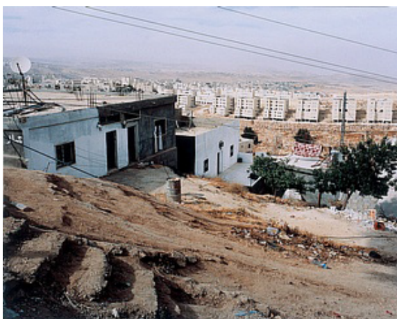
Shufaat Camp, Jerusalem, 1997 Photographie couleur, 80 x 100 cm

Philippe Durand nous fait «entrer dans ce monde, celui du capitalisme mondialisé, qu'il trace tout en évitant la caricature et en partant toujours du poétique pour aller vers le politique, ce qu'il appelle par un néologisme, le «poélitique»» (Lise Guehenneux, L'Humanité , 6 janvier 2009). D'autres artistes de sa génération peuvent se retrouver dans cette notion entre poésie et politique.