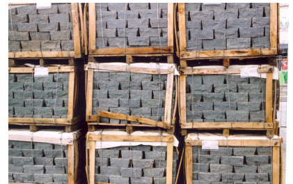
De haut en bas Raymond HAINS, Les sculptures de trottoir , 2003 Photographie couleur 60 x 40 cm Raymond HAINS, Les sculptures de trottoir , 2003 Photographie couleur 100 x 66 cm