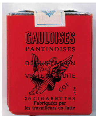
Jean-Luc Moulène, Documents: Objets de Grève , 2002

La Pantinoise. Paquet de cigarettes rouge. France, usine des tabacs de Pantin (Seine-Saint-Denis), Seita, 1982-1983. Courtesy galerie Chantal Crousel, Paris © Jean-Luc Moulène - ADAGP, 1999.