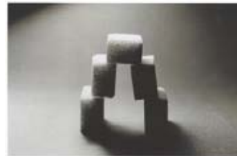
La Tour de Babel

né en 1954 à Tarragone (Espagne), vit près de Montpellier.