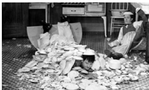
Charlot, dans The Pawnshop , (Charlot et l'usurier), 1916.