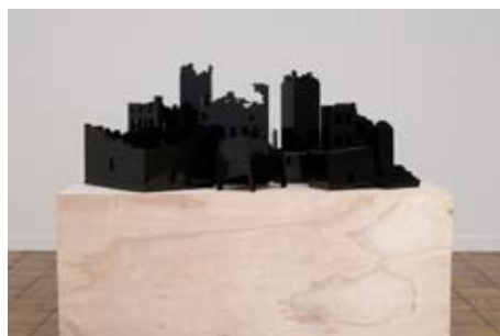
Territoires rêvés , 2008 Lego bricks noirs 80 x 120 x 170 cm Collection Frac Basse-Normandie

Née en 1974 à Strasbourg, vit et travaille à Berlin.