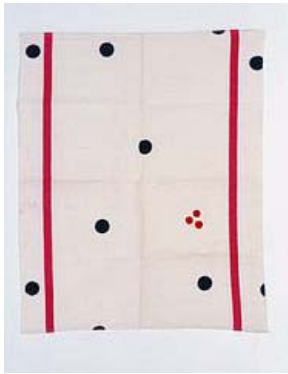
Torçon , 1971 Peinture acrylique sur toile de coton 71,5 x 58 cm collection Frac Basse-Normandie

Né en 1945 à Nice, vit et travaille à Nice