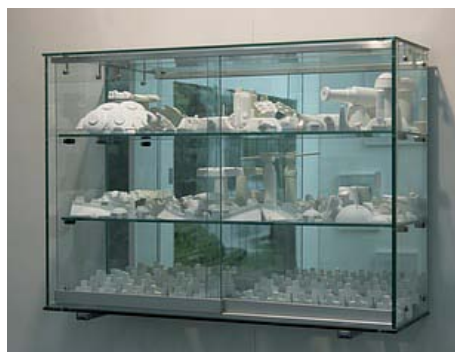
White War , 2005 Objets recouverts de plâtre, verre, métal 57 x 78 x 27 cm Collection Frac Basse-Normandie

Né en 1961 à Roubaix, vit et travaille à Paris.