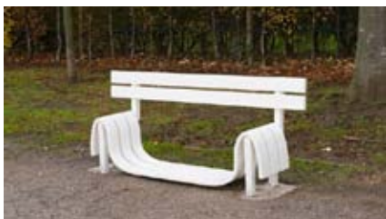
Modified Social Bench E , 2006 Acier galvanisé peint par poudrage 75 x 180 x 45 cm collection Frac Basse-Normandie

Né en 1974 à Copenhague, vit et travaille à Berlin