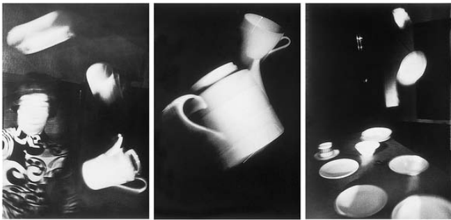
Scène de médium, 1987 triptyque, photographie noir et blanc, 41 x 37 cm chaque Collection Frac Basse-Normandie

«Anna + Bernhard Blume pourraient passer pour une sorte de Deschiens d'outre-Rhin, habiles dans la mise en scène absurde de la vie quotidienne, décalée et pitoyable, prompts à se moquer furieusement du couple étriqué. (...). On nage en plein burlesque. Sauf