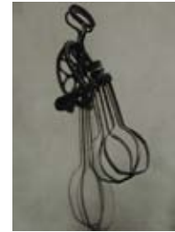
Woman, 1920 Centre Georges Pompidou, Musée national d'art moderne, Paris, © ADAGP, Paris

“Beau comme la rencontre fortuite d'un parapluie et d'une machine à coudre sur une table de dissection”. Man Ray marque, avec ses objets étranges, le glissement de l'esthétique de révolte vers la poésie de l'étrange. Il crée des analogies entre le corps et l'objet, ou le transforme en objet.