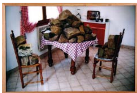
Sans titre , 2001 photographie argentique couleur, 110 x 160 cm Collection Frac Basse-Normandie

Né en 1970 à Valenciennes, vit et travaille à Caen