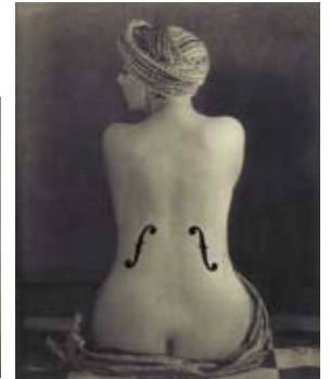
Le violon d'Ingres, 1924 Photographie 31 x 24,7 cm © Man Ray Trust ADAGP, Paris