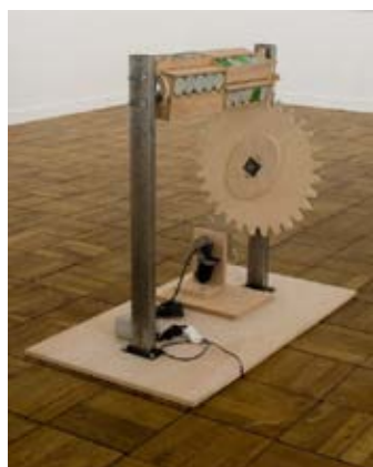
Beuglophone électrique , 2007 Fer, bois, moteur électrique, boîtes musicales 80 x 60 x 90 cm Collection Frac Basse-Normandie

Né à Paris et à Laffaux (France), vivent et travaillent à Paris