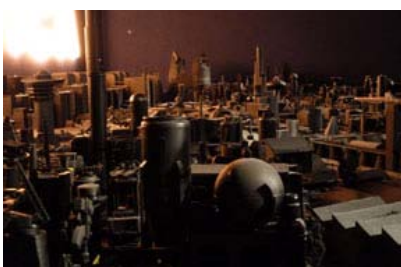
Archeologie / exotica , 2000 15 m x 11 m environ, carton, objets de récupération, néon