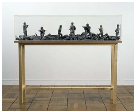
Don't be a Chocolate Soldier , 1969-1994 Moulage en chocolat, bois, plexiglass 155 x 170 x 40 cm Collection Frac Basse-Normandie

Né en 1946 à Negba (Israël), vit et travaille à Paris.