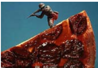
War 6, 1974

Né en 1947 en Tchécoslovaquie, vit et travaille à Paris