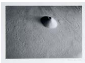
Récit de voyage, 1983 Photographie noir et blanc Ensemble de 11 photographies 24 x 32,5 cm chacune Collection Frac Basse-Normandie (détail)

Le Récit de voyage de Patrice Carré est une variation qui mêle les constructivistes russes pour la question de la composition ou de la construction et Marcel Duchamp pour le ready-made et l'élevage de poussière, à quoi s'ajoutent : le plaisir des matériaux et des formes, l'exactitude de la construction, l'irrévérence, une façon de mettre en acte l'expression de Bertold Brecht :